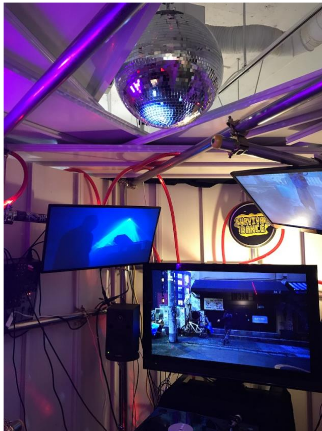
新井健 《Survival Dance》